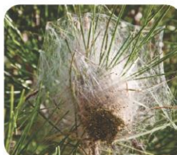
Niu de Thaumetopoea pityocampa